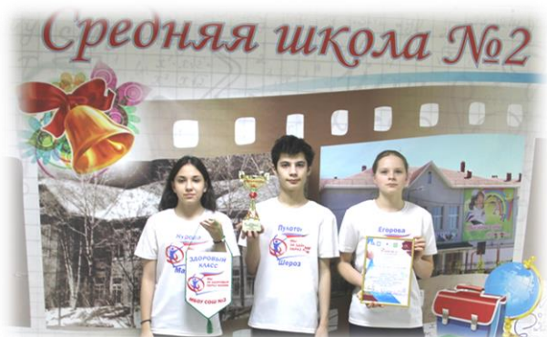
МБОУ СОШ №2- победитель муниципального конкурса «Здоровый класс»