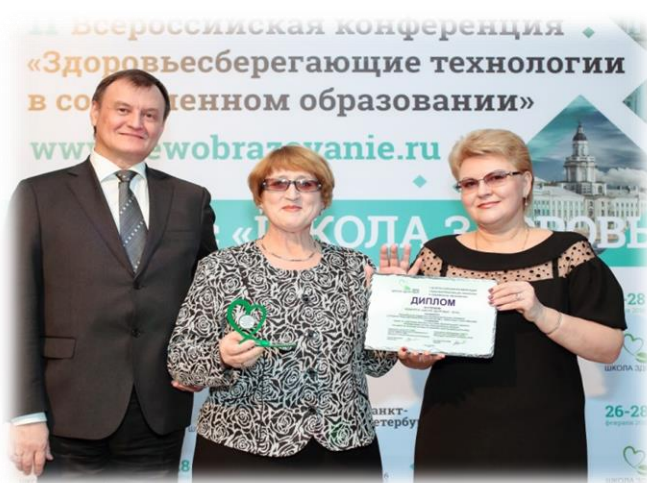
МБОУ СОШ №2- победитель Всероссийского конкурса «Школа здоровья»